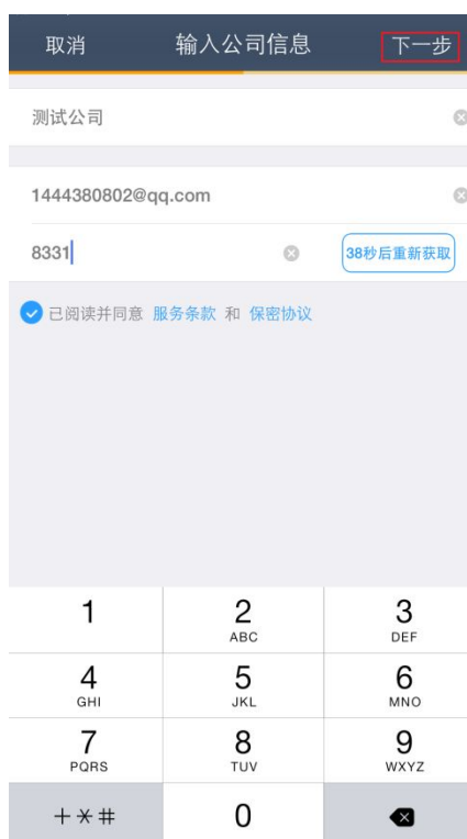
获取到验证码后点下一步